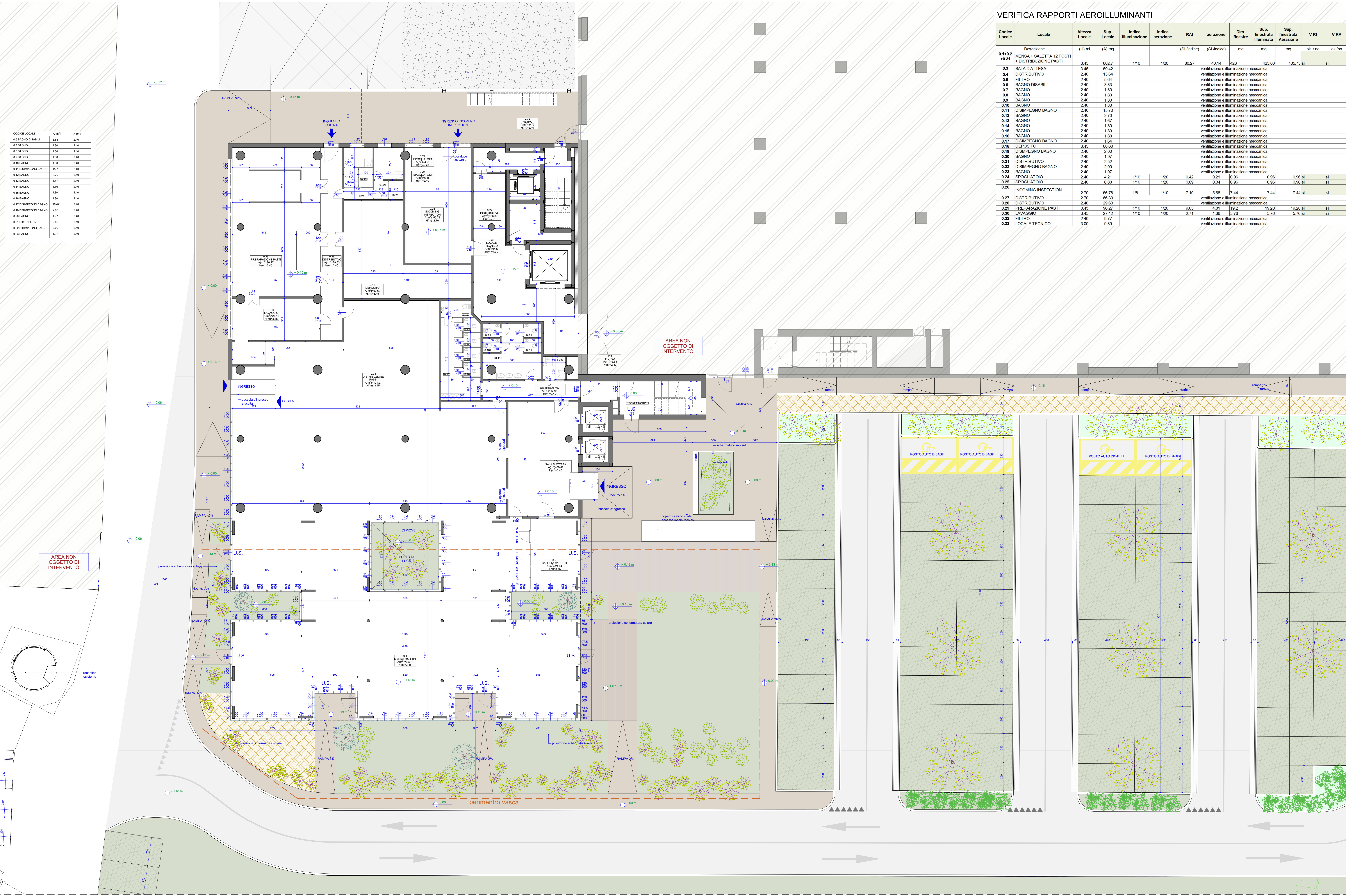
PIANTA PIANO TERRA, +0.15, MENSA/CUCINA